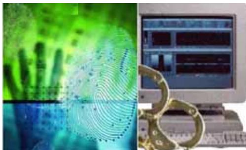
Slika 68. Kriminal na mreži

Spisak krivičnih djela koja se mogu počiniti zloupotrebom Interneta je prilično velik.